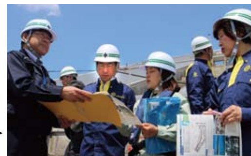
岩手県陸前高田市 → 防潮堤復旧工事現場