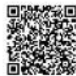
大阪防災アプリ ダウンロードはこちら