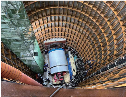
立杭上部から見たシールドマシン

古川雨水幹線バイパス管工事は、萱島ポンプ場へ効率的に雨水を集めるとともに、寝屋川市西部地域の雨水が集中する古川水路の雨水流量の負担を軽減するために、府道木屋門真線の地下に直径 2.4 メートルと直径 1.0 メートルのバイパス管を埋設する工事です。