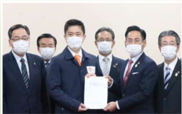
吉村知事に要望書を提出 府庁 (2022.12.22)