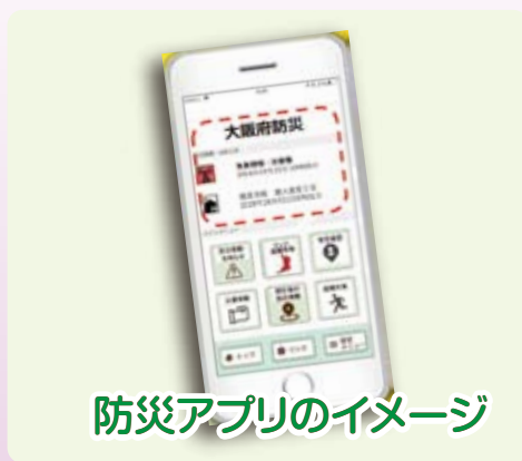
防災アプリのイメージ

近い将来、確実に起こるとされる「南海トラフ巨大地震」 日頃から府民が防災対策を図り、迅速な非難をするためには必要な情報を速やかに発信することが重要です。府は災害情報や気象情報等を迅速に府民に対し提供するためのアプリを導入することになりました。ひご府議は災害から自分や大切な人の命を守るため、効果的なアプリとなるよう訴えました。