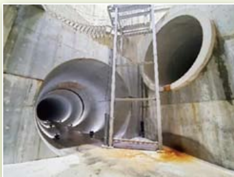
▲ 共用中の守口調節池