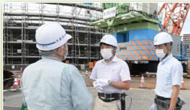
▲ 城北立坑築造工事現場視察

寝屋川北部地下河川は令和8年の城北立坑の完成をめざし整備中、完成後は立坑上流部の鶴見調節地の整備に速やかに着手予定です。引き続き、水害からまちを守るため治水対策の強化に取り組んでいきます。