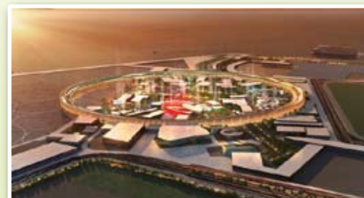
▲ 大阪・関西万博 会場パース図(夕景)