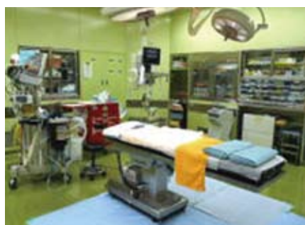
(※画像は「大阪府立中河内救命救急センター」HPより)