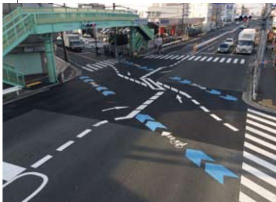
府道13号線 菅原神社前交差点