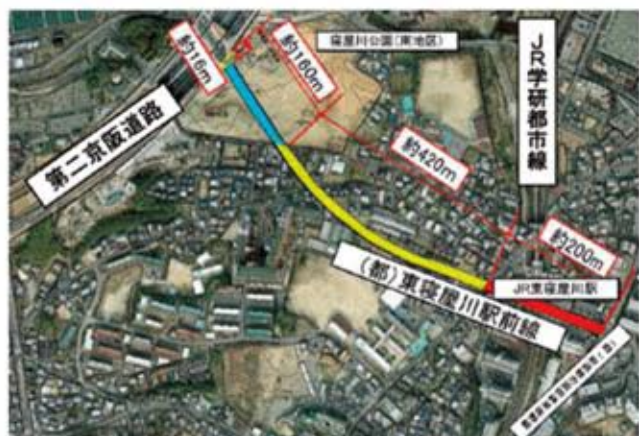
整備が求められる420m(黄色部分) 青色部分は今年度整備予定、赤色部分は整備済

この東部地域のまちづくりにおいて、東寝屋川駅前線の整備は必要不可欠な社会的インフラであります。寝屋川市では、市東部地域のまちづくり検討を始めたところです。