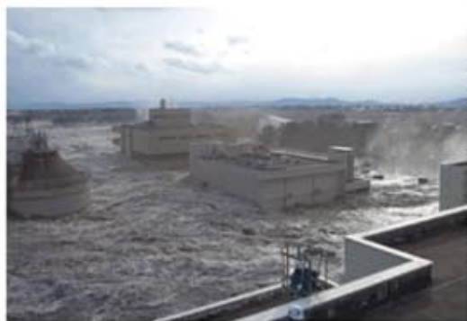
下水処理施設 水没状況

8月26日、災害対策調査特別委員会で被災地の宮城県に行ってきました。宮城県の県南浄化センターは津波により甚大な被害を受けていました。