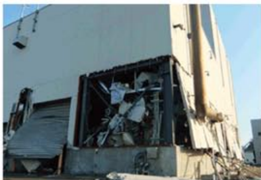
下水処理施設 被災状況

8月26日、災害対策調査特別委員会で被災地の宮城県に行ってきました。宮城県の県南浄化センターは津波により甚大な被害を受けていました。