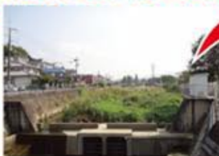
川勝町・打上川治水緑地下流(現況)

空間に続き、3箇所目の親水空間となる「打上川治水緑地下流」の平成24年度内の整備実現と安全対策の充実を確約しました。