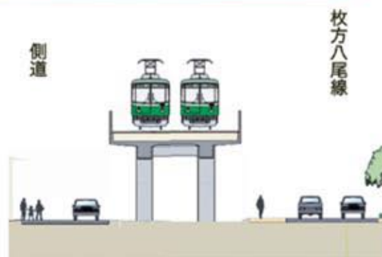
京阪本線(寝屋川市・枚方市)連続立体交差事業

の事業完成を強く求めました。今後、府では、これまで3年間の検討を踏まえ、鉄道の高架化とこれに関連する道路整備などの都市計画素案を作成。来年春には、環境影響評価の準備書等に係る地元説明会の開催を予定。地元説明会等を通じて十分な説明を行い、平成25年度の事業着手に向けて取り組んでいきます。