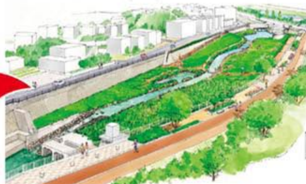
平成24年度完成予定イメージ図